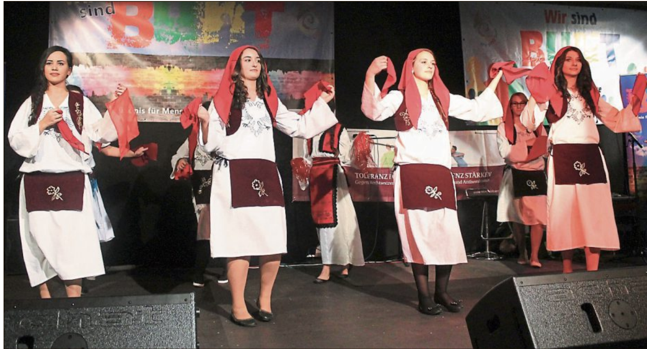
In aufwendiger Tracht im Alten Schlachthof zu Gast: eine Tanzgruppe aus Dingolfing-Landau.

ausgelassen und freundlich. Ein beeindruckendes Beispiel für den rücksichtsvollen Umgang vieler unterschiedlicher Nationalitäten. Ein imposantes mit unzähligen Köst-