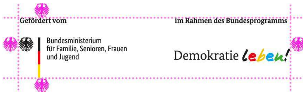
Illustration: Schutzraum um das Logo